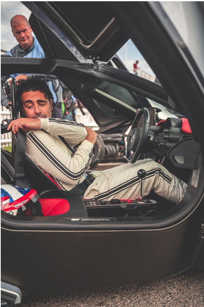
Gordon Murray hat uns einen ersten dynamischen Eindruck des T.50 mit Dario Franchitti am Steuer geschenkt, während seine jüngste Entwicklung mit gut über 10.000 Umdrehungen um Goodwood herum tobte. Zugleich wurde eine statische Version des Niki Lauda-Modells geboten, die ausschließlich auf den Track-fokussiert ist.