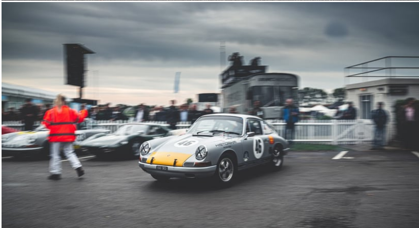
Die während wurden während der einzelnen Events und quer über alle Grids packend ausgetragen. Die MG kämpften um Mittelplätze und die Porsche schlängelten erbittert um Plätze an der Spitze des Felds. Der Pierpont Cup am Samstagabend bescherte jede Menge Nervenkitzel: Modelle wie Mustang, Falcon und Galaxie kämpften hart um jeden Meter vor der untergehenden Sonne.