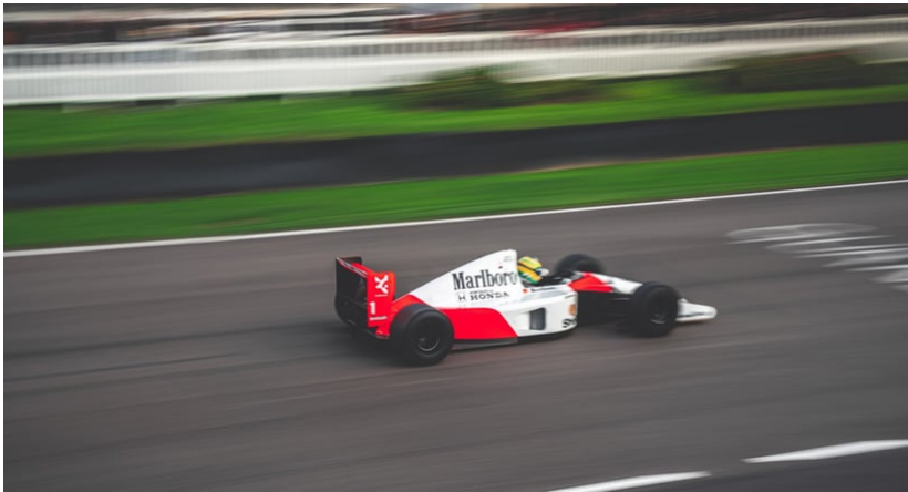
Ayrton Senna ist ein Namen, der viele von uns immer noch sehr tief berührt. Sein Neffe Bruno Senna würdigte seinen Onkel in angemessener Form mit ohrenbetäubenden Runden in einem McLaren MP4/6 mit Honda-V12. Zu hören, wie dieses Auto – ungestört von anderem Motorengetöse – um diesen Kurs in Sussex jagte, war für alle, die dabei sein konnten, ein unvergesslicher Moment.