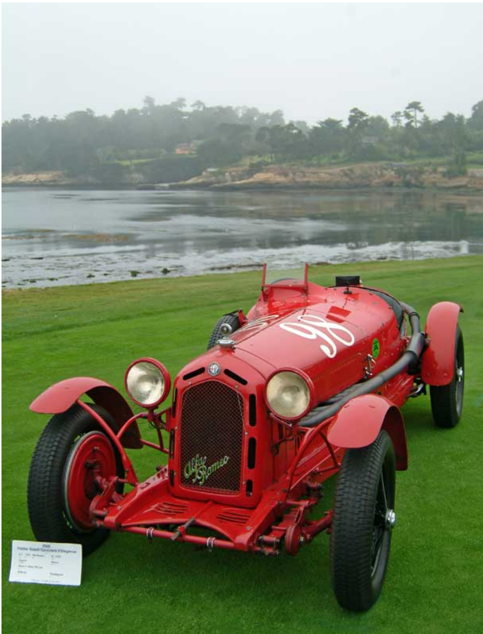
2008 Alfa Romeo 5000 cc 1930 1930 1930 1930 1930